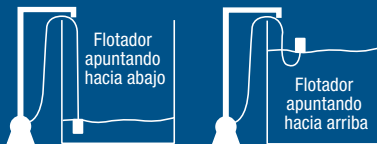
DIAGRAMA DEL FLOTADOR

Su flotador cuenta con un cable de 2 metros de longitud, por lo que le permitirá ajustar el nivel según lo deseado. Introduzca el cable del flotador por el orificio del contrapeso de manera que el cable atraviese completamente el contrapeso. Una vez realizado lo anterior, recórralo a través del cable para aumentar o disminuir el nivel del agua dentro del tinaco.