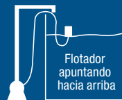
DIAGRAMA DEL FLOTADOR