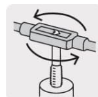
Maneral tipo garrote