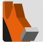
Dientes de carburo