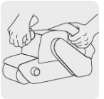
Operación a dos manos