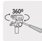
Base con giro horizontal