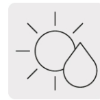
Para cortes en seco y húmedo