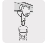
Oreja de acero