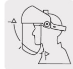
Abatimiento de 90°