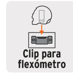
Clip para flexómetro