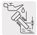
Sensor de nivel bajo aceite