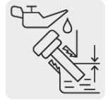
Sensor de nivel bajo aceite