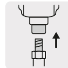
Rosca y tuerca para fácil integración (Eje M14)