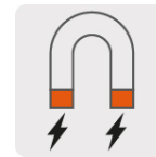
Imán que facilita la sujeción