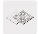
Loseta y cerámica