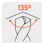
Ángulo de punta