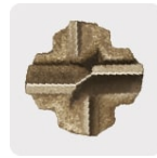
Punta de cruz