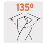
Ángulo de punta