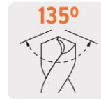
Ángulo de punta