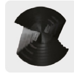
Punta Split Point