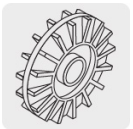
Impulsor de latón