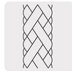
Manguera de alta presión