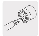
Sistema de conexión rápida