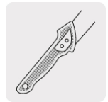
Sierra 5 dpp