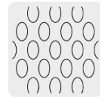
Malla al reverso