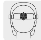
Ajuste de matraca