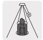
Rescate en espacios confinados