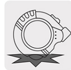
Resistente a impactos