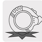
Resistente a impactos