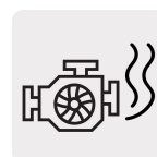
Baja emisión de humo