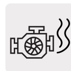
Baja emisión de humo