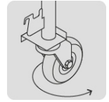
Rodajas de poliuretano que giran 360°