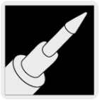
Punta cónica fina