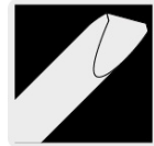
Punta en "V"