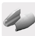
Mordazas de acero