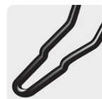
Bastidor 1 pieza