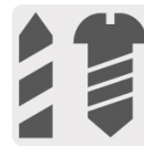
Taladro y Destornillador