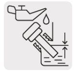
Sensor de nivel bajo aceite