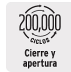
Cierre y apertura