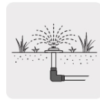
Para sistemas de riego y jardín