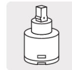
Cartucho cerámico (CARMO-20)