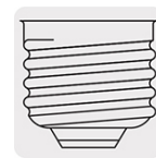
Base E26 / E27