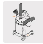
Almacenamiento de accesorios incorporado