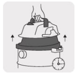
Asa de liberación rápida que facilita el vaciado