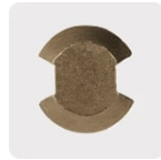
Punta de cruz