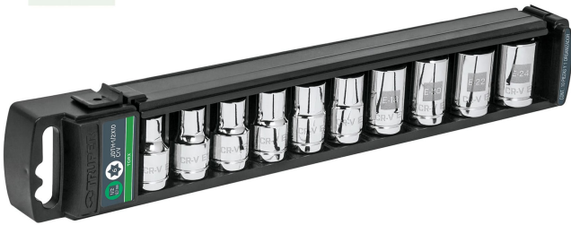
Estuche de plástico

E-8 E-16 E-10 E-18 E-11 E-20 E-12 E-22 E-14 E-24