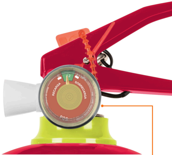
Manómetro robusto resistente a la corrosión con indicador de recarga y sobrecarga