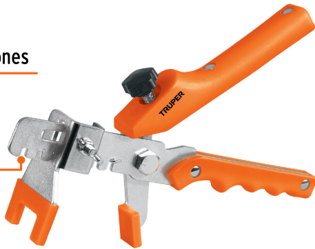
Largo 232 mm