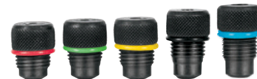
Boquillas con indicador de color para fácil identificación de remaches