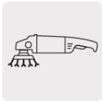
Para esmeriladora de 4 1/2"