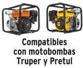
Compatibles con motobombas Truper y Pretul

Conducción de grandes flujos Manguera plana para mayor flexibilidad y fácil almacenamiento