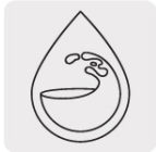
Para agua limpia