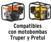
Compatibles con motobombas Truper y Pretul

Conducción de grandes flujos Manguera plana para mayor flexibilidad y fácil almacenamiento