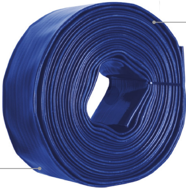
Resistentes a rayos UV