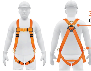
Anillos laterales para posicionamiento